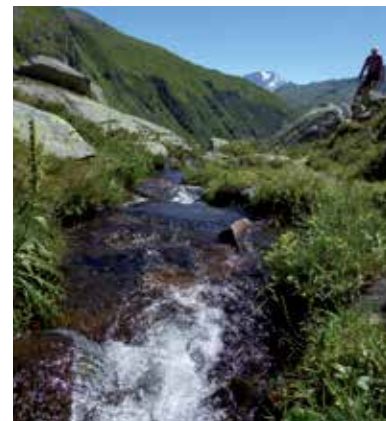
Mountains full of beautiful moments in the Gastein valley.